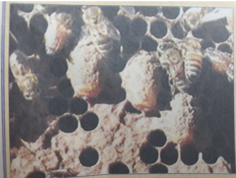
Семејството само си прави матици