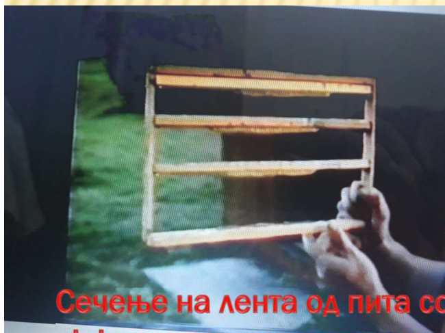
Сечење на лента од пита со јајца и зацврстување на летва во празен рам